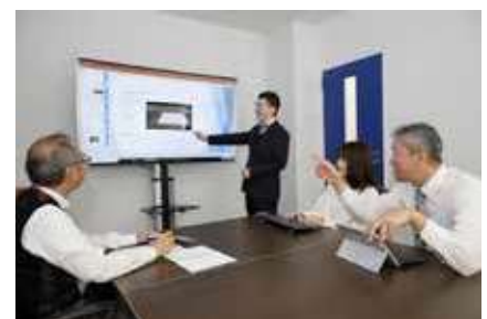
ベテラン社員と若手社員の打合せ風景

社員の興味や技術習得に応じたスキルアップを支援するため、資格取得支援制度を設けている。本制度を利用して「情報処理安全確保支援士」資格を取得した社員を、ISMS情報システムチームや内部監査チームに配置するなど、適性や希望を考慮して活躍できる場を提供している。また、業務知識に精通したベテラン社員と大学院で高度な専門知識を習得した若手社員を、1チームにして業務を担当させたことで、両者のスキルアップだけでなく、顧客からも高評価が得られ、その後の継続的な取引につながっている。