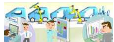
ものづくりを支えるソフトウェアサービス

ものづくり全体を、ソフトウェアサービスによってトータルにサポートする。企画立案から設計・開発、ハードウェア・ソフトウェア選定、保守まで、一貫したサービスを提供。さらに、見える化ソリューションやITコンサルティングなど、これまでに培った知識、スキル、経験などの強みを活かして、企業のIT利活用や、業務効率化に向けた事業も展開している。自ら顧客にアイデアを提案することでサービスの付加価値を向上し、ソフトウェアサービスで我が国のイノベーションを支える取組を実施している。